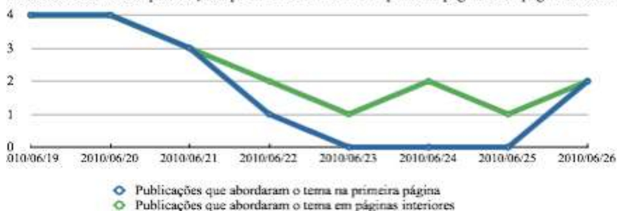
Gráfico 2: Diversidade de publicações que mantiveram tema em primeira página e em páginas interiores

desse género, ainda ambíguo e que designamos por jornalismo Cultural. Vamos, para já, ater-nos ao sentido mais breve e imediato da expressão Jornalismo Cultural: tratamento